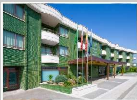
Boo de Piélagos